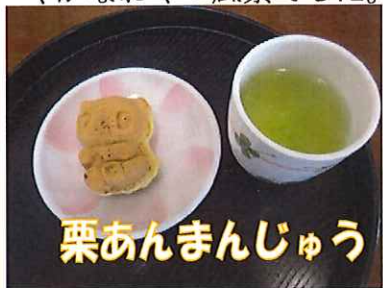
栗あんまんじゅう

ゲーム終了後のおやつは、栗や芋など正に秋の味を楽しむもので話題にもなり賑やかなおやつ風景でした。