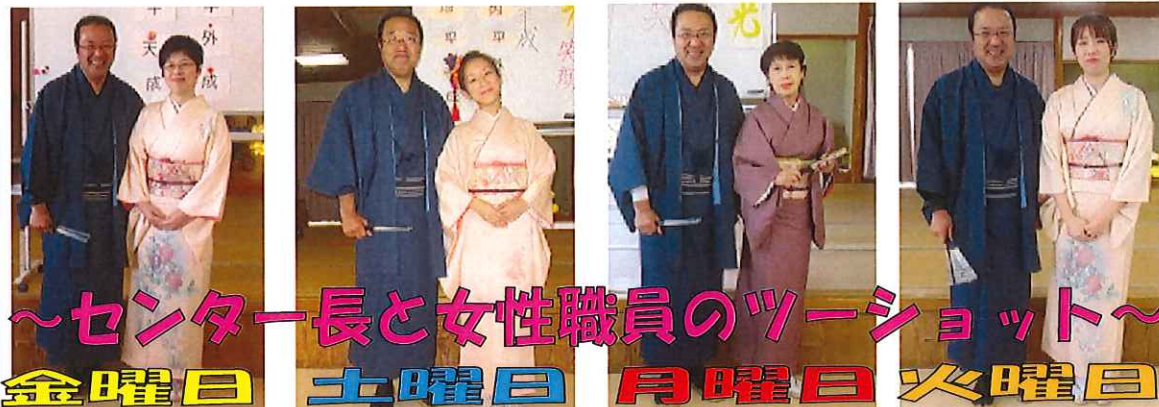
～センター長と女性職員のツーショット～ 金曜日 土曜日 月曜日 火曜日

まず初めに、正月らしい出で立ちの着物姿のセンター長による新年の挨拶、その後、各曜日ごとに女性職員が代わって着物姿で登場！女性職員の艶やかな着物姿に、「綺麗か〜」「可愛い」と皆さん、すごく感激し喜ばれました。女性職員の新年の挨拶が終わると、「お屠蘇配り」を行いました。