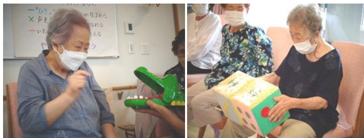
指をかまれないように「そ〜と」 パワーを注入して転がします

七月のレクリエーションは「ぱくぱくワニさいころゲーム」です。高得点を獲得するのに、技術は関係なし。運任せですが、念を込めて「ソクシ・・・見事に？総得点が没収されましたが、実は最後の最後に大逆転が起き全員大笑いです