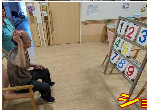
ショートステイの様子