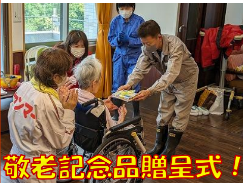
敬老記念品贈呈式！

毎年ふる里では敬老をお祝いして職員からの手作りの「敬老記念品」をプレゼントしており、今年はカード入れを作成しお渡ししました。花柄の素敵な色合いに仕上がり、センター長直筆の「交わる笑顔素敵な和」の言葉を添えて一人一人にお渡ししました。皆様の普段の生活に使っていただけたら幸いです。