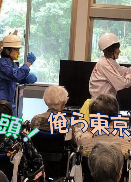
俺ら東京さ行くだ〜