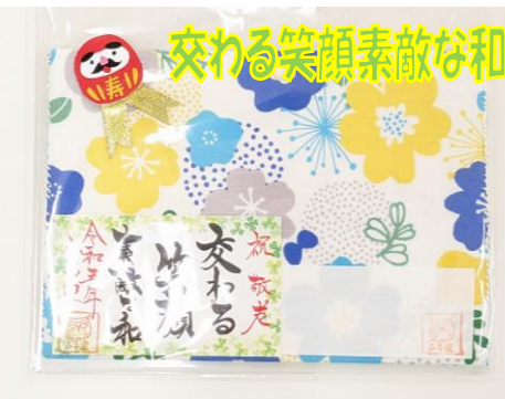
交わる笑顔素敵な和