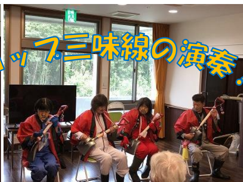
4コップ三味線の演奏！

毎年ふる里では敬老をお祝いして職員からの手作りの「敬老記念品」をプレゼントしており、今年はカード入れを作成しお渡ししました。花柄の素敵な色合いに仕上がり、センター長直筆の「交わる笑顔素敵な和」の言葉を添えて一人一人にお渡ししました。皆様の普段の生活に使っていただけたら幸いです。