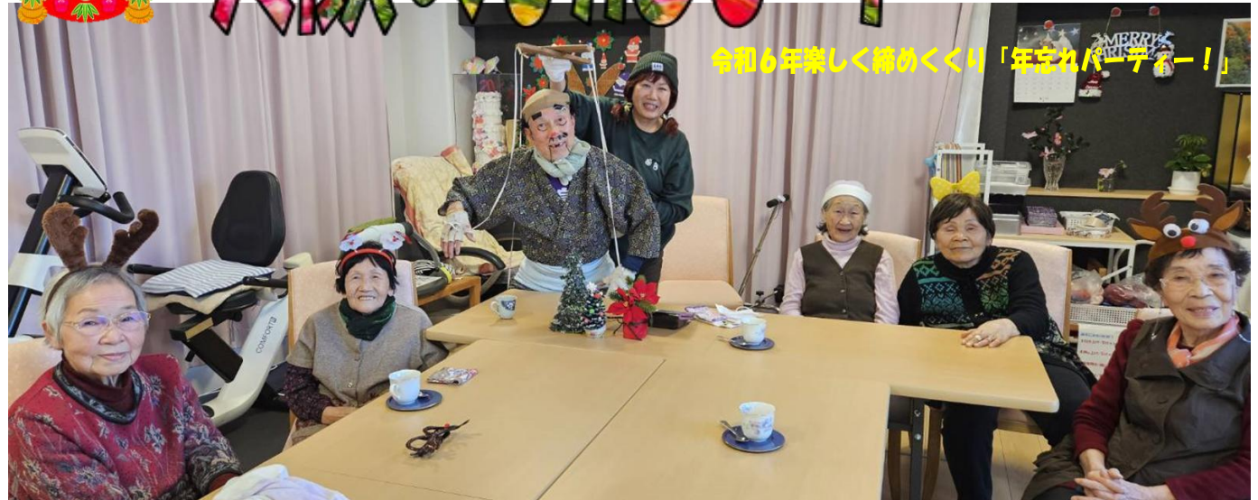
令和6年楽しく締めくくり「年忘れパーティー！」

長崎県大村市鬼橋町1416番地 TEL (0957)27-4500 FAX(0957)27-4501 ホームページ検索: 社会福祉法人 隆明会