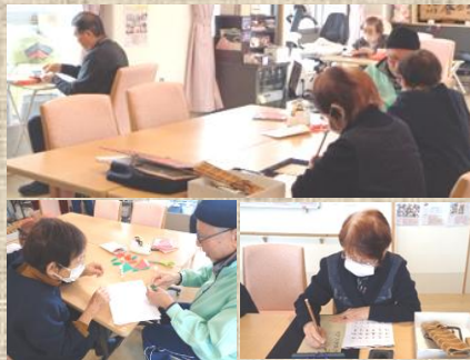
折り紙・ナンプレ・書道等を行っています

午後の活動までの昼休憩時間は、横になりゆっくり過ごす方が多いですが、読書や脳トレをして過ごされる方もおられます。