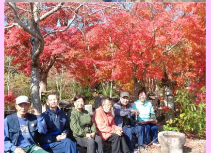
上の写真は「野岳湖」下は「宮崎農園」です