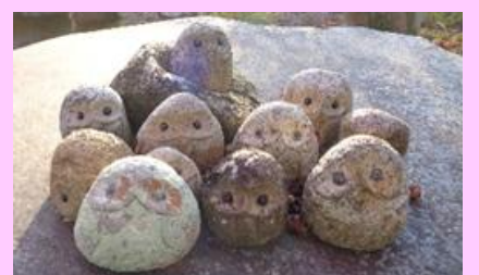
「ふる里」のマスコットたちをバチリ!! 宮崎農園で見つけた「石のふくろう」……