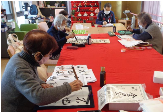
金曜日は書道の仲間が増え、書道愛好会が発足しました。お互い励ましあいながら頑張ります。