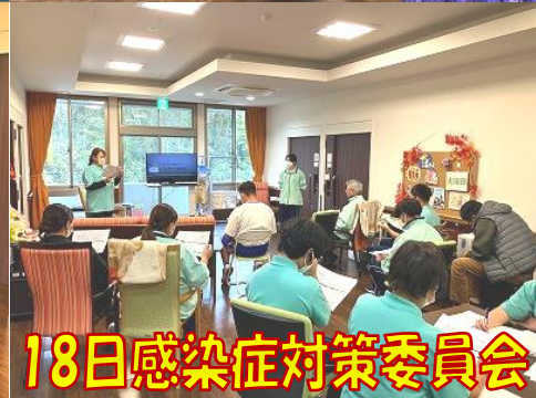
18日感染症対策委員会