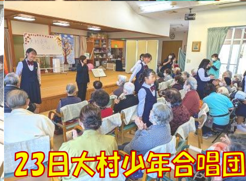
23日大村少年合唱団