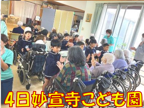
4日妙宣寺こども園