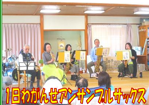
1日わがんせアンサンブルサクソ